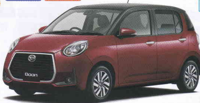
Photo:ブーンシルク"Gパッケージ SA III" ボディカラーはブラックマイアム(XM)×ファイアークォーツメタリック(R67)はメーカーオプションで56,000円高